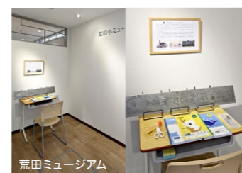
荒田ミュージアム