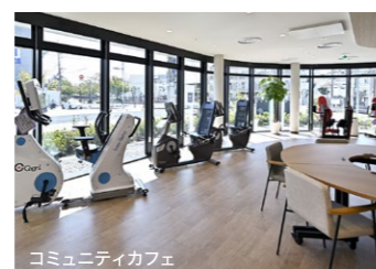
コミュニティカフェ