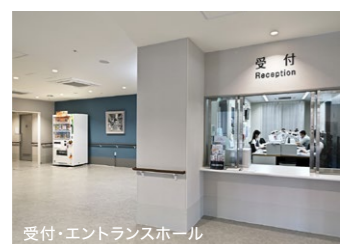
受付・エントランスホール

● 交差点に面した「ラグナケア荒田」は、かつては荒田小学校のグラウンドでした。新たな施設の建設をきっかけに、この場所と地域が未来へと動き出し、子どもから高齢者まで多世代が交流できる施設を目指します。