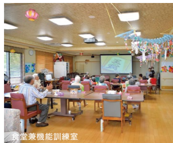
食堂兼機能訓練室

●小規模多機能型居宅介護・地域密着型介護老人福祉施設・ショートステイ・デイサービス・居宅介護支援事業所と、多彩な5つの機能が揃う先進的な複合型介護施設で、ご利用者お一人おひとりに適したきめ細かいケアサービスを提供しています。