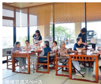
地域交流スペース