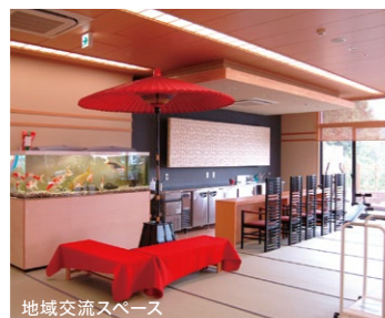
地域交流スペース

●「ラグナケア千鳥山荘」は、地域コミュニティとの共生を目指して生まれた施設です。ここでは、地元の婦人会やまちづくり協議会の皆さんが日常的に集い、高齢者の方々とふれあって、あたたかなコミュニケーションの輪を広げています。